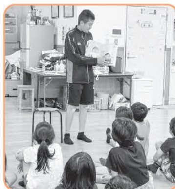
放課後児童クラブ