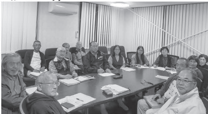
滝本コミュニティハウスでの会議の様子

滝本地区で活動されている「滝本地区見守り会」を取材させていただきました。滝本地区は、区内での孤独死事例がきっかけで、令和4年4月より「滝本地区見守り会」の活動を開始されました。2人1組で、気になる方のお宅へ行き、「元気にしょんさるん？」を合言葉に訪問活動をされており、訪問活動は毎月実施されます。