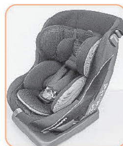
子育て・介護用品貸出事業へ