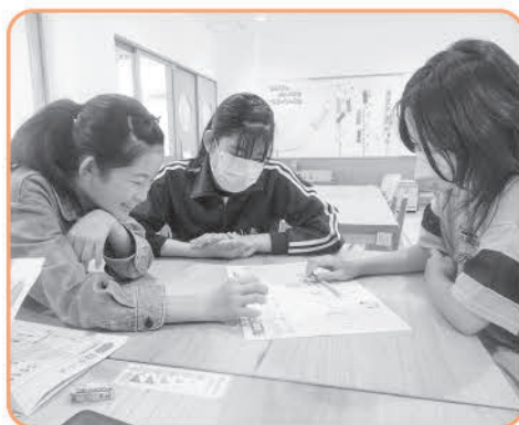
チャイルドホーム