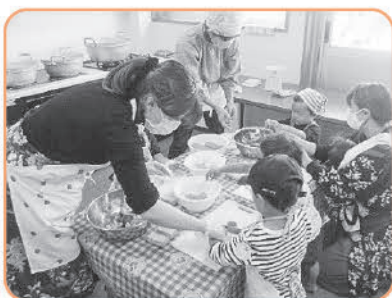
子育て支援事業へ