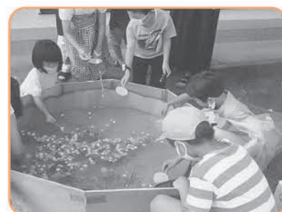
各地区で行われる 地域福祉活動事業へ

社協会員へのご加入・会費についてはお問い合わせください。【問い合わせ】社会福祉協議会 電話36-6363