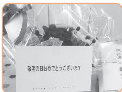
各地区で行われる敬老会などの 長寿万歳事業へ